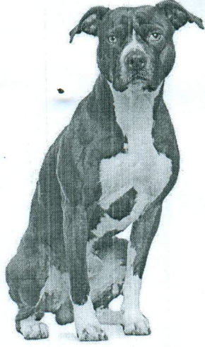
American Pitbull Terrier