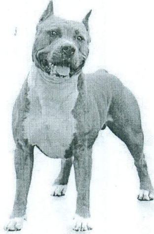
American Staffordshire Terrier